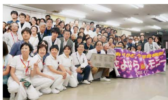
セレモニーでの記念撮影

開設以来、温かく、また厳しく ご指導・ご支援いただいた皆さま に向け、青年職員によるリレート ークも行われました。医師・看護 師などそれぞれの職種が、「いの ちの平等」「地域まるごと健康つ くり・まちづくり」の理念を受け 継ぎ、頑張り決意を発表し、参加 者から大きな拍手が送られまし た。