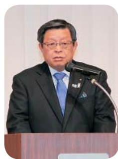
竹山おさみ堺市長