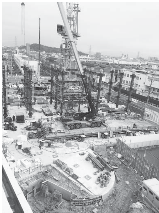
手前の円形が「ふれあいエントランス」(東向きに撮影)