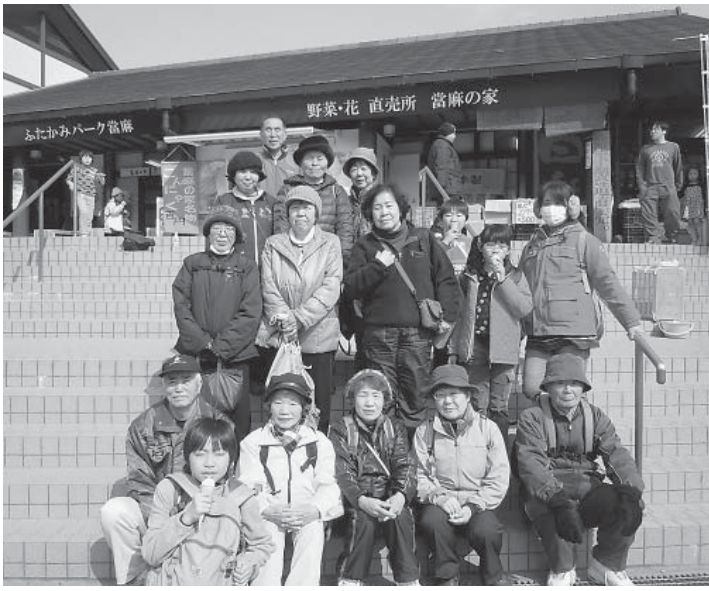
小さい春をみつけ、大人からも子供からも歓声が

2月28日(金) ふれあい 昼食会でおひなまつりを開 きました。 桃の花を生け、おひな様 を飾ると、皆さんすっかり