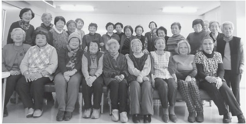
はまぐり潮汁・菜の花白和え・手作り桜餅に、ひなまつりの歌も歌いました

乙女気分。この日の献立は ちらし寿司、 はまぐりの潮 汁、菜の花の 白和えなど。 デザートは手 作りの桜餅、 利用者さんに も手伝ってい ただき出来上 がり。ひなま つりの歌も歌 い、恒例の集 合写真を撮 り、皆で美味 しく昼食を頂 きました。