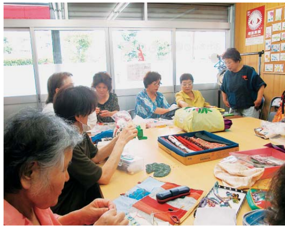
八田宮園「ともの家」の様子

医連の事業所もなく地域的なつながりを広げることが課題になつてきているときにできたたまり場です。