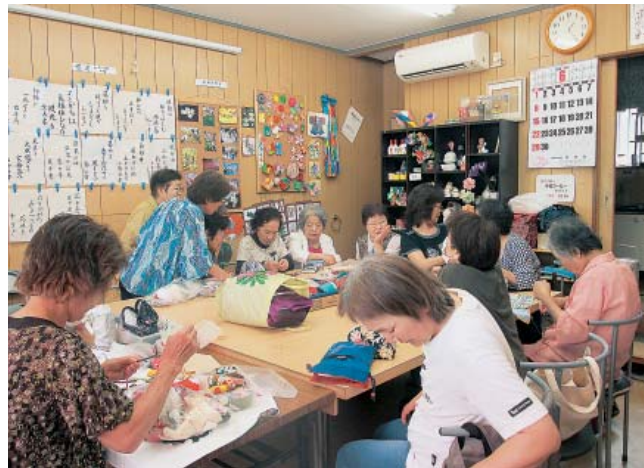
八田宮園「ともの家」の様子

八田宮園「ともの家」は、「健康友の会みみはら」として初めての、5年前にできたたまり場です。中区支部が結成され、民 「活動のイメージをつかむことができた。これなら八田でもできるな」と場所探しからスタートさせました。 はじめはなかなか人が定着せず、議論の上、毎月二千をこえるチラシを8ヶ月程度まき続けました。「安心してつどえる場所」と地域に認知されるまで半年はかかりました。待たれていたのではありませんか、それから人は人が人へと呼び支部分割へと広がっていきました。