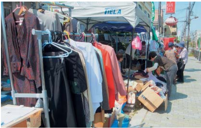
地域からも好評の産直野菜とバザー、健康チェック

「家でケンカしたらここへ来るわ」の声も出るほどで、手作り、おしゃべり、コーヒータイムなど、自由