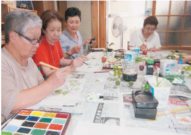
参加者が多く新金岡でブームになっている絵手紙