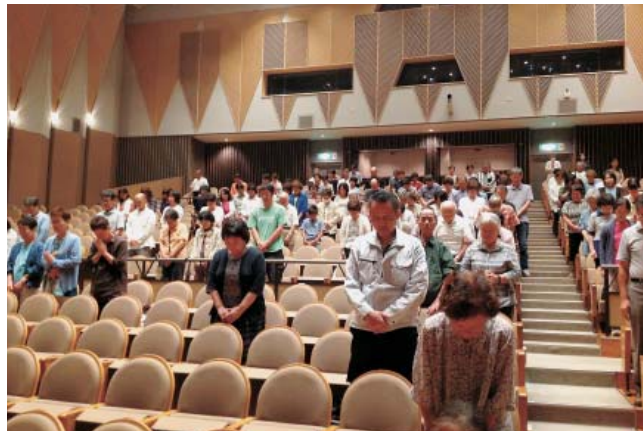
上映にあたり黙とうも行われました

事前申し込みが必要です。 (健康友の会みみはら事務局組織部 072-244-8061まで) 詳細は申し込み時にお伝えします。