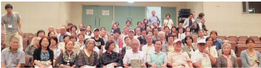
健康友の会みみはらから参加した会員さんと職員

『憲法を暮らしに』の垂れ幕が両府庁に掲げられていた事を想起していた。「憲法25条を教えるなら、生保の手続きの仕方、28条なら、労働組合の作り方で教えないとだめだ」との力強い弁に涙が出そうになった。そして同じ弁護士で憲法のイロハも無視の橋下市長への怒りを新たにされた。