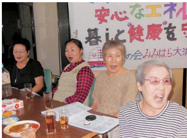
歌う会ではみんなで楽しく大きな声で