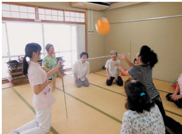
体操教室で楽しく風船バレー