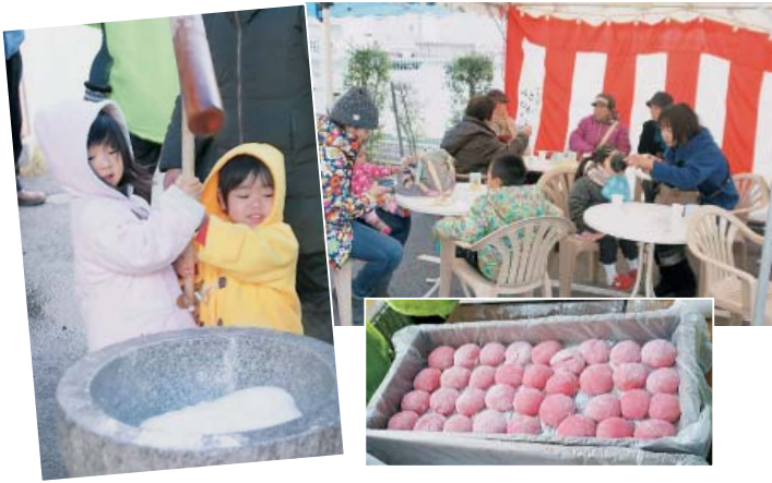
今回は友の会結成30周年を祝して、赤いおもちも登場!