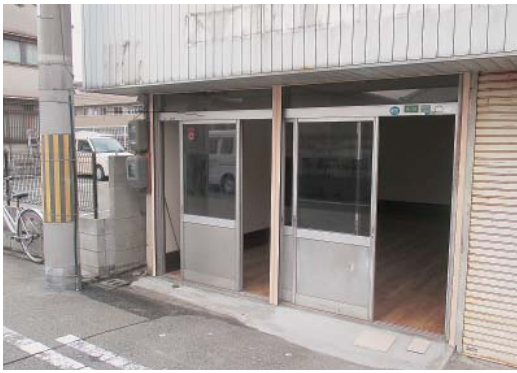
たまり場の外観と内部(下)