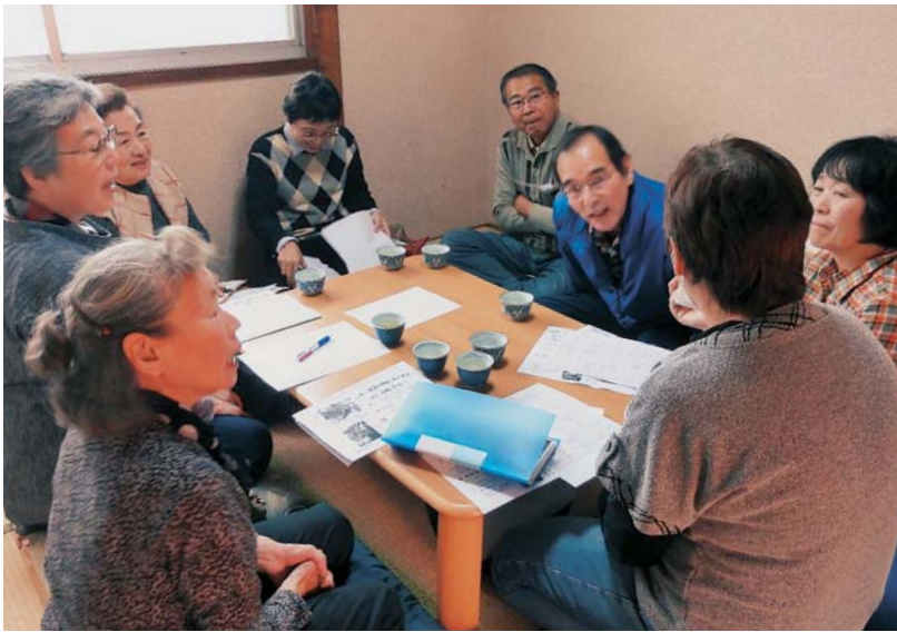
新金岡支部との交流

け、実際にどのような活動を行っているのか、運営はどのようになっているのか、光熱費等はどのようになっているのかなど、伺っています。今回お借りできることになった物件は、以前は作業場にもなっていたため、手を入れる必要があり物件が決まったから時間がかかりましたが、健康チェックや、趣味の集まり・医療学習会・バザーなど、楽しい居場所を目指して準備を進めています。ぜひ、みなさんお越しください。