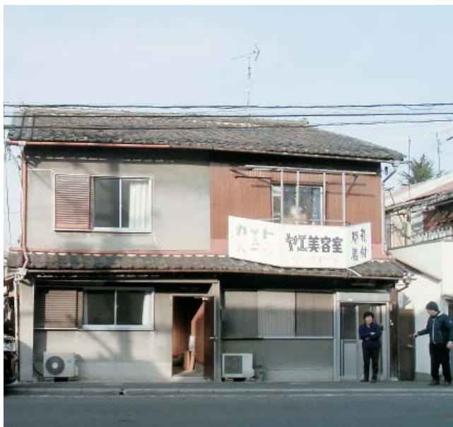
「鳳ともの家ちぐさ」の外観

大鳥大社の境内を覆う鬱蒼とした樹木が「千種の森」と呼ばれていたこともあり、地域で古くから親しまれてきた「千種」という名称にちなんで、『鳳ともの家ちぐさ』と名づけました。