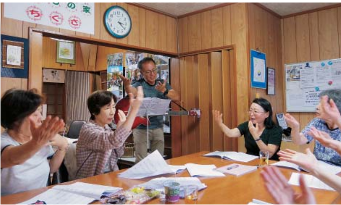
みんなで歌う教室