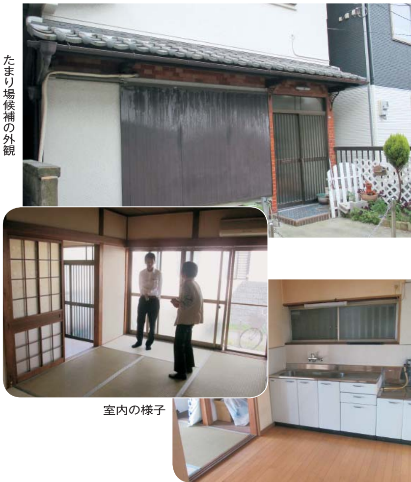
たまり場候補の外観