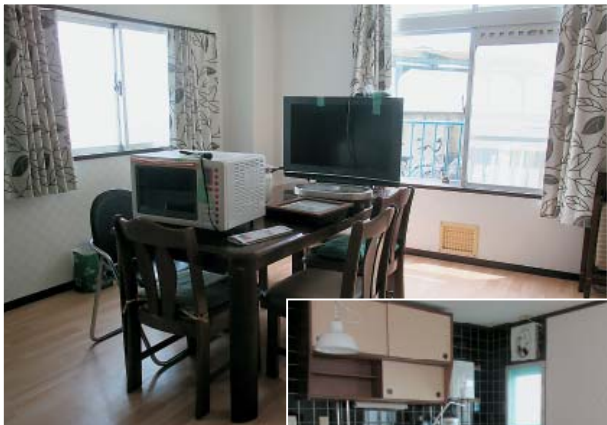
世話人さんを中心に必要な荷物を運びこんで...オープンめざして鋭意！準備中