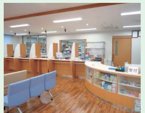
プライバシーに配慮したカウンター

〒590-0822 堺市堺区協和町4丁465-2 TEL 072-244-7131