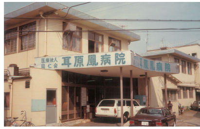
就職当時の耳原鳳病院