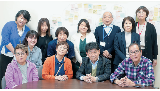
会世話人さんや地域から不安や潜在的ニーズをお聞きすることがあります。

地域コミュニティ棟は同仁会本部西側に、2025年2月末竣工、4月オープンをめざし現在建設中です。建設委員会ではこれまで11回の会議をかさね、構想の具体化をすすめています。みみはらグループでは地域住民との付き合いの多くは「医療介護が必要になってから」始まります。一方で「医療介護のことで将来が不安、医療介護につながっていない人がいる」など、友の