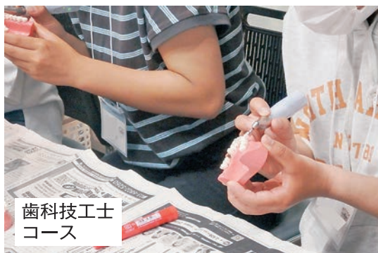
歯科技工士コース

スでも、実際の現場で使っている器具や機械を用いてプロ(同仁会職員)から教わることで、非常な機会となっており、非常に凝った内容の体験ができたようでした。参加者からは「実際に器具や薬に触れて体験できたのですごく楽しかったです！勉強へのモチベーションが上がりました！」「名前しか知らなかった職業をしっかりと体験できて、将来選択の幅が広がりました」「イメージしていた職業とは全然違ったりして、将来を考えると良い勉強になりました」「医療職って大変だと思うけれど、それ以上に感謝してもらったり、やりがいを感じる事ができる、とても良い職業で魅力的だと思います」などの感想が届きました。