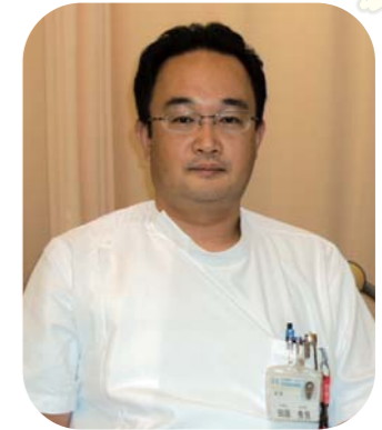
耳原総合病院 泌尿器科 部長

先日の5月15日、リーガロイヤルホテル堺にて当院が年2回開催している【地域医療を勧める会】で、泌尿器科医以外の在宅医および開業医の先生方を対象として「在宅・診察室での泌尿器科疾患に関する診察のポイント」を発表させていただきました。今回はこの発表内容の要旨を報告したいと思います。