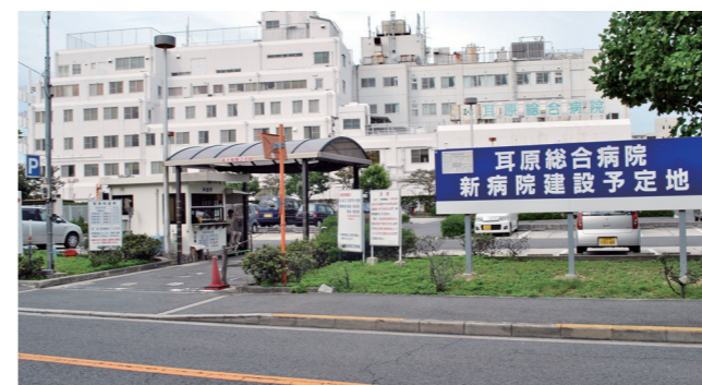
新病院建設予定地側より