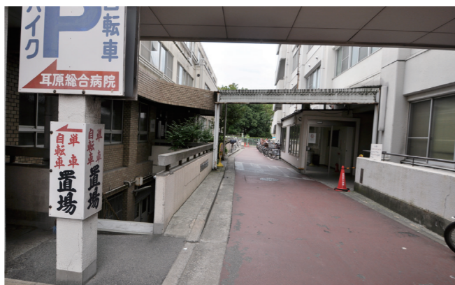
新館と別館をつなぐ道