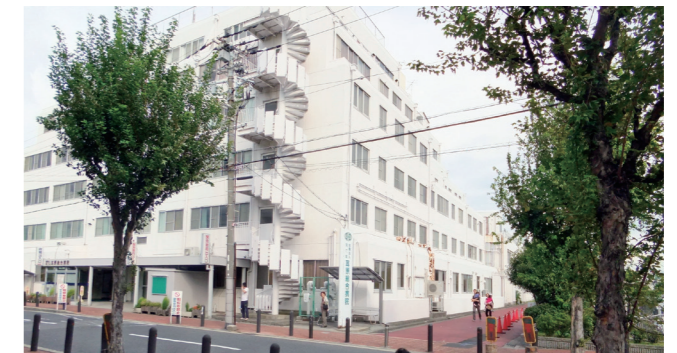
塩穴通から見た病院