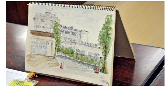
参加者のスケッチ