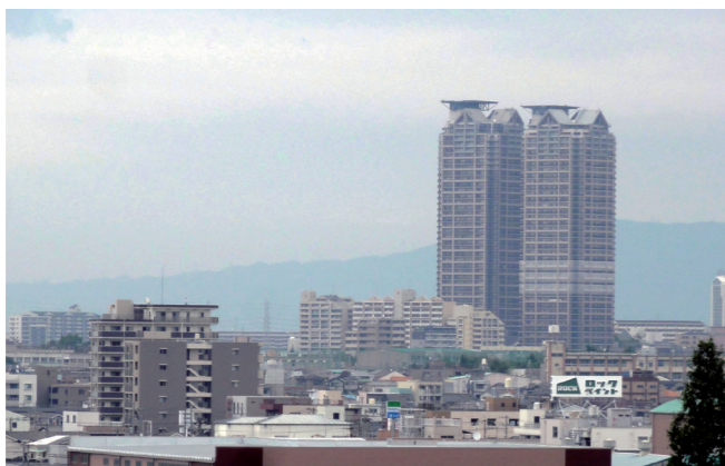
病院屋上から見える風景