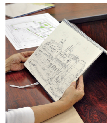
参加者のスケッチ