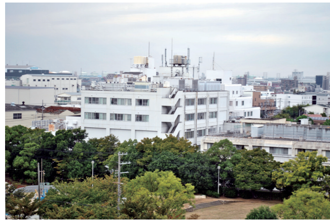
団地から見た風景