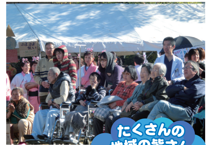
たくさんの地域の皆さん