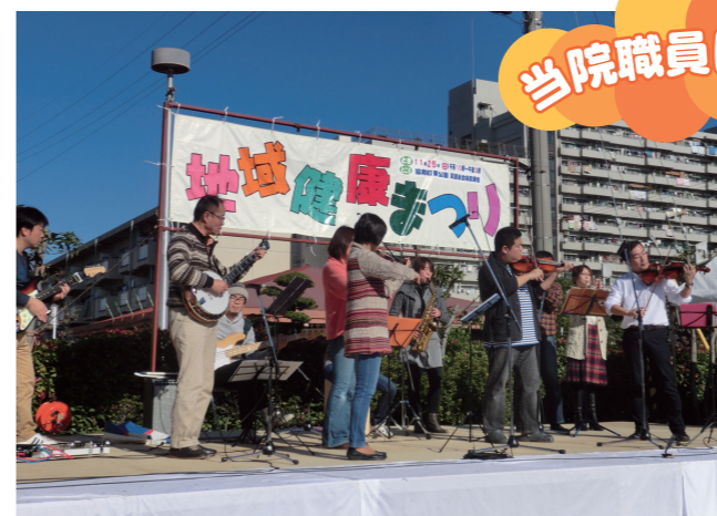
当院職員による演奏!

秋晴れの11月25日(日)、 “みんなでつくろう新病院、安心・安全の街づくりを進めよう!!”を 合い言葉に、第13回地域健康まつりが 協和町東公園で開催されました。 お天気に恵まれ、参加人数は2500人でした。