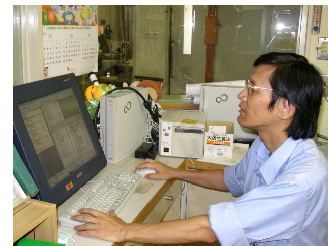
病棟も頑張っています(^_^)v

耳原総合病院地域医療室 電話 072-241-0324 Fax ①072-241-0208 Fax ②072-241-0670 予約受付時間 月・水・金 午前9:00～午後7:00 火・木 午前9:00～午後5:00 土 午前9:00～午後1:00