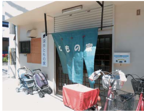
手作りの「のれん」が目印です

た。慣れた人はそれぞれ教え合い、手は動かして、口は近況報告を和やかな雰囲気ですすみしました。