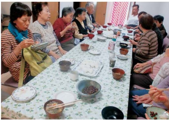
参加者で満員の食事会

貸農園に行った時、おいしそうなきつまいもが収穫されています。さつまいものツルは、「ミミ」として捨てられます。「ほっこり」へ