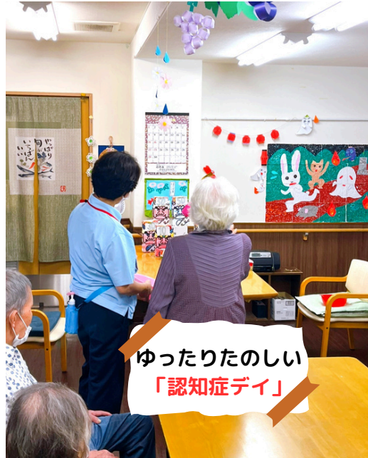
ゆったりたのしい 「認知症デイ」