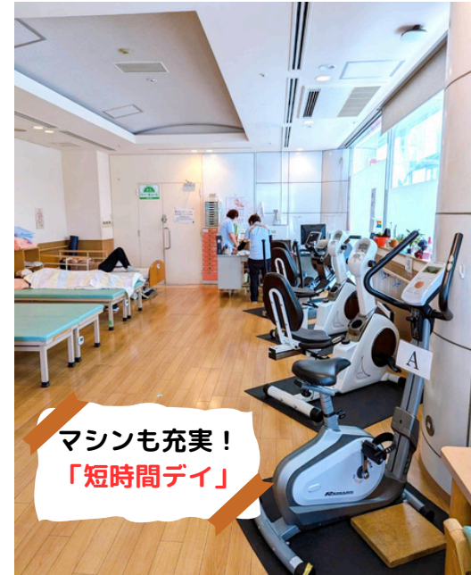
マシンも充実！ 「短時間デイ」