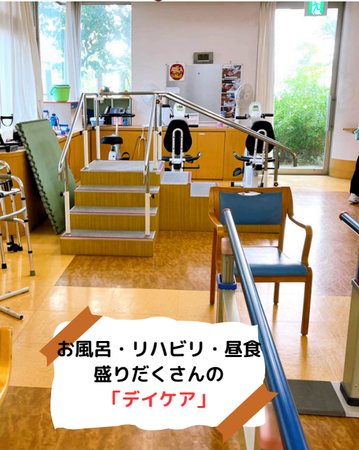
お風呂・リハビリ・昼食 盛りだくさんの 「デイケア」