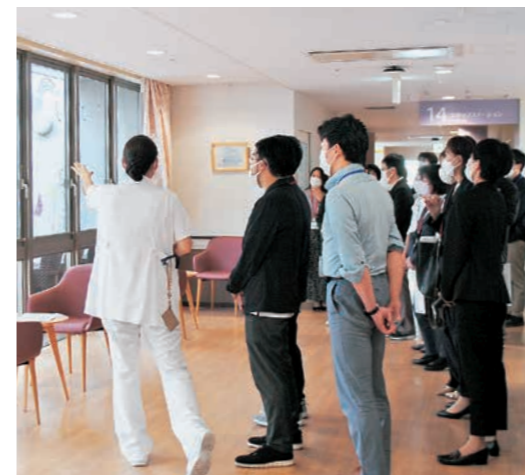
緩和ケア病棟見学のようす

当院の治療実績や取り組み等の講演を通じ、地域の先生方とともに目指す医療や地域連携について交流を深める大切な研修会です。今回は、院内の見学時間を設け、緩和ケア病棟やER、心臓カテーテル検査室などを見学していただきました。また、手術室では手術支援ロボットda Vinciを実際に操作していただき、「操作できてよかった。」「最新医療に触れられて勉強になりました。」などのお言葉をいただきました。