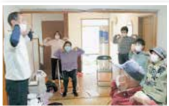
フレイル予防体操