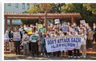
ガザジェノサイド反対集会