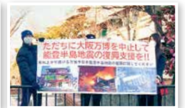
万博より「能登震災支援」を