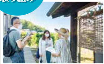
美木多地域会員訪問