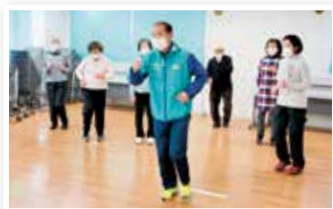
ウォーキング講習会