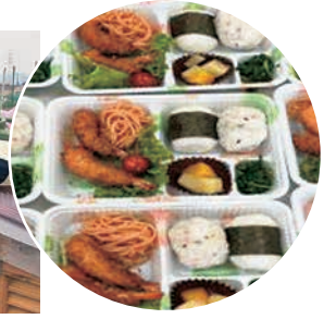
メリアキッズクラブ (お弁当)