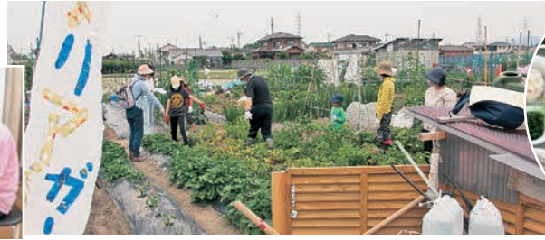
メリアガーデン (2022年)