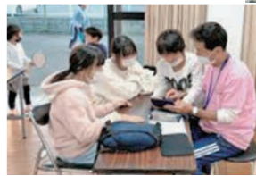
メリアキッズ学習 (2022年)