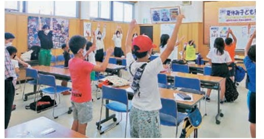
ちぐさ夏休み子ども塾 (2022年)