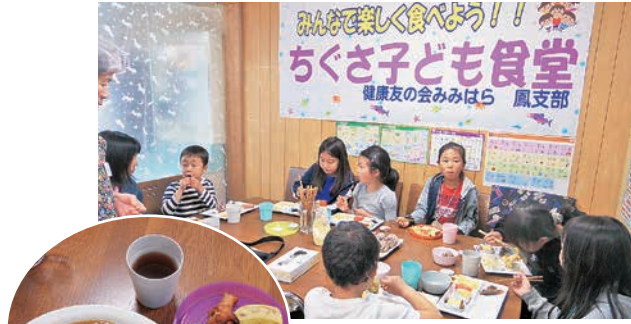
ちぐさ子ども食堂 (2019年)

共同組織の取り組みは、友の会の会員を対象に捉えるだけでなく、地域全体を視野に入れた取り組みへと広がってきました。健康友の会みみはらでも、子ども食堂・子ども塾を通じての子育て支援、子どもの居場所づくりなど、子どもを対象とした取り組みが近年広がっています。鳳支部では、2016年から夏休み子ども塾、2018年から子ども食堂、2022年から無料塾(寺子屋ちぐさ)をともの家で開催。南花田支部と新金岡支部合同で、2022年から子ども食堂と子どものサポート(メリアキッズクラブ)、子どもたちに安心な野菜を食べてもらいたいと、畑を借りて(メリアガーデン)有機無農薬菜園をしています。総合病院HPH委員会の無料塾との連携ははじまりました。すべての地域で子どもの取り組みを広げていきます。